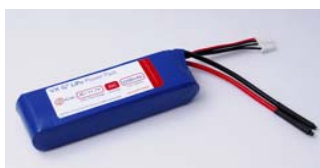
G3 VX 35C Series