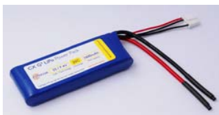
G3 CX 25C Series