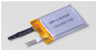
"-1S" Loose Cells